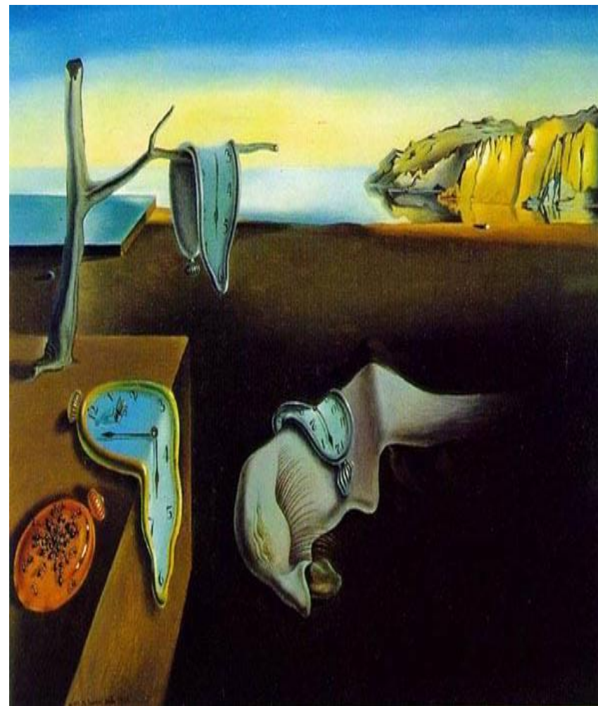
Salvador Dalí, The Persistence of Memory (1931), Μουσείο Σύγχρονης Τέχνης, Ν. Υόρκη

Η οικονομία της κατεχόμενης Ελλάδας και οι κατακτητές.