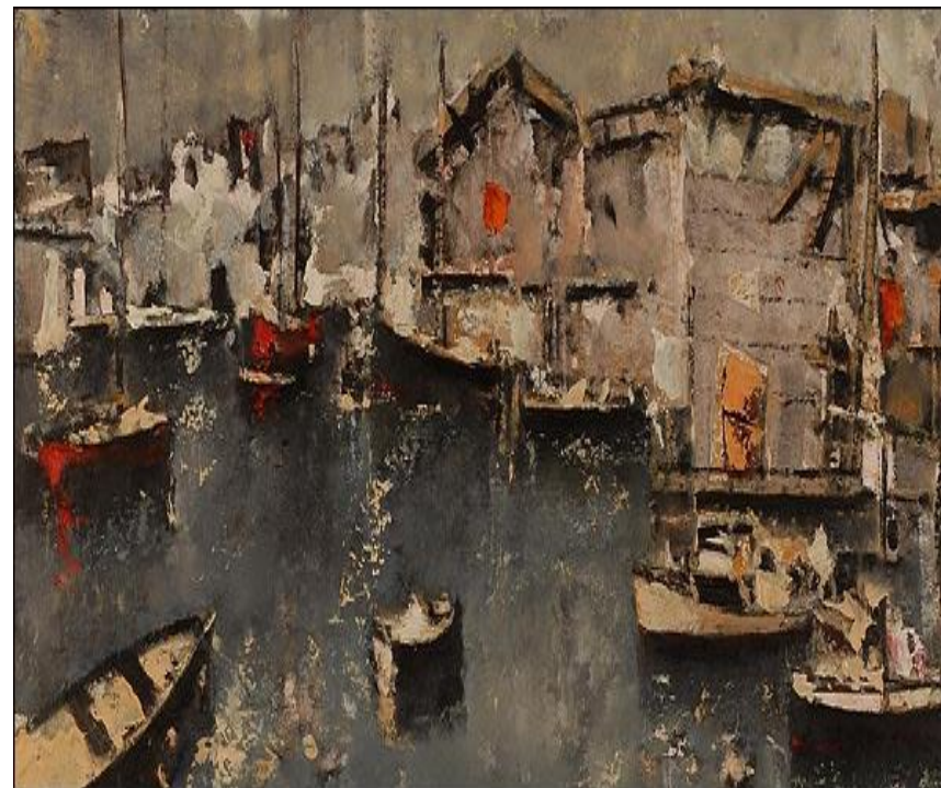
Γιάννης Σπυρόπουλος, Το λιμάνι της Βενετίας (Μύκονος)

Οι εργοστασιακές απεργίες στην Πάτρα της πρώιμης Μεταπολίτευσης. Μια πρώτη απόπειρα ανάλυσης.