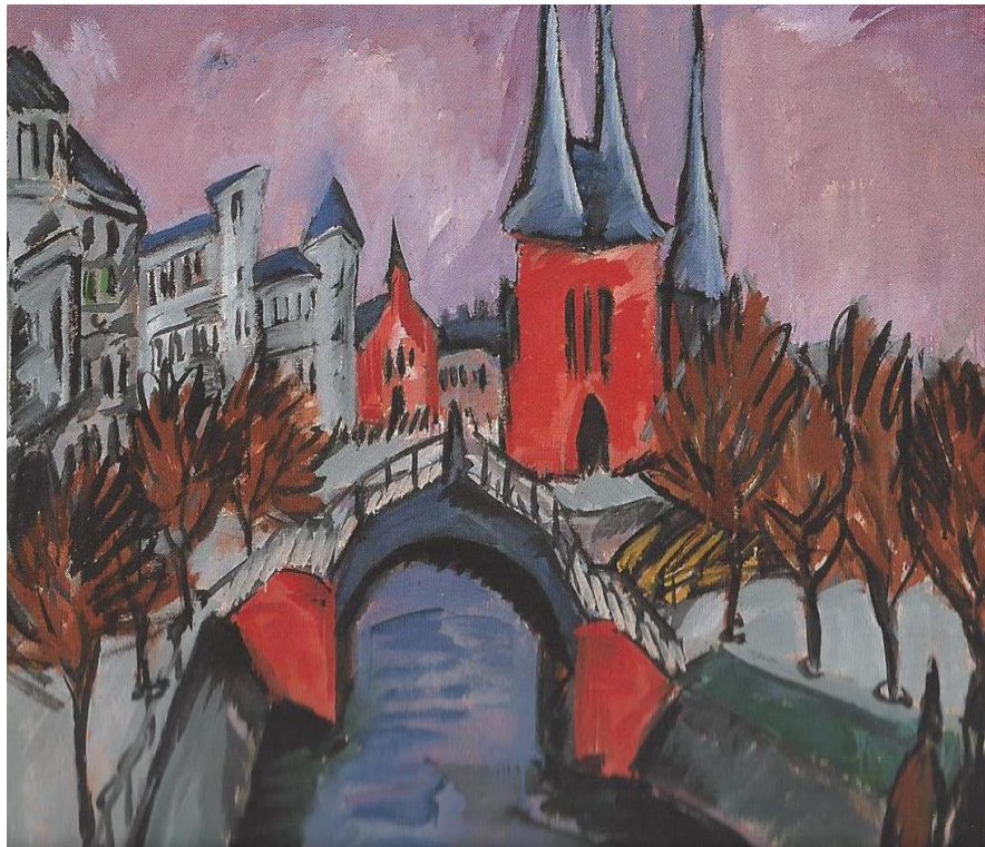
Ernst Ludwig Kirchner, Elisabethufer, 1913, Πινακοθήκη Μονάχου

19 η Θερινή Συνάντηση Μεταπτυχιακών Φοιτητών Νεότερης και Σύγχρονης Ιστορίας Ρέθυμνο, 14-15 Ιουλίου 2014 Αίθουσα 56 του Τμήματος Ιστορίας-Αρχαιολογίας