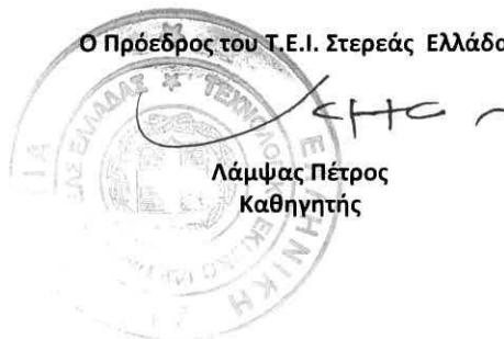
Λάμπας Πέτρος Καθηγητής