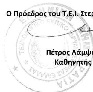
Πέτρος Λάμπιας Καθηγητής