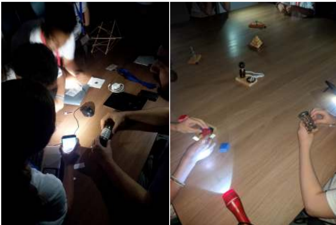
Φωτογραφία 13: Αστροβραδιά/αστροπαρατήρηση για το 1 ο Θερινό Σχολείο Μαθηματικών