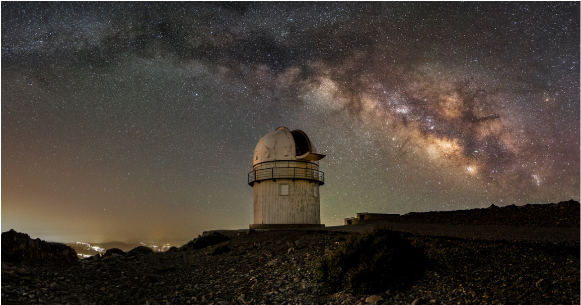
Το τηλεσκόπιο 1.3μ κάτω από το φως του Γαλαξία μας στο Αστεροσκοπείο Σκίνακα