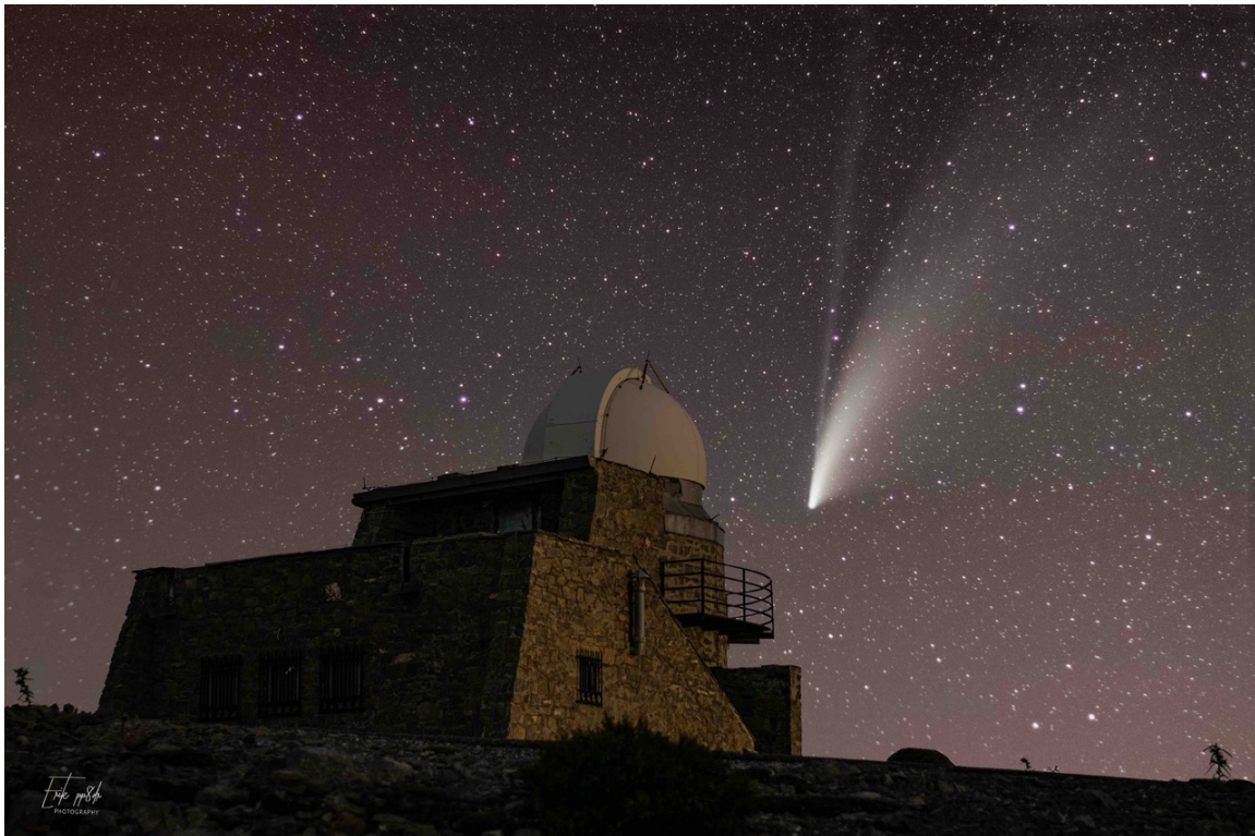
Ο κομήτης NEOWISE πίσω από το τηλεσκόπιο των 30εκ. του Αστεροσκοπείου Σκίνακα.

Περισσότερες πληροφορίες: https://skinakas.physics.uoc.gr/