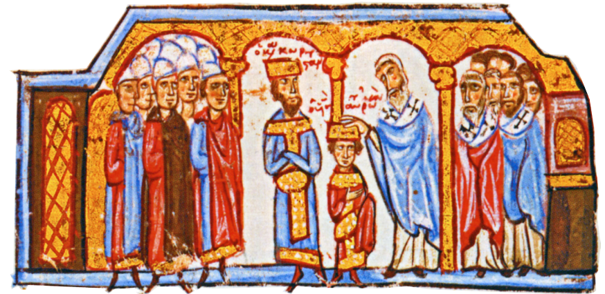
Le couronnement de Romain II, fils de Constantin VII Porphyrogénète (codex Skylitzes Matritensis, f.133v)