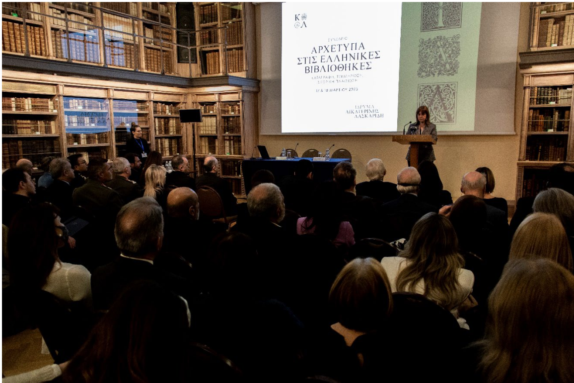
Η Πρόεδρος της Δημοκρατίας Κατερίνα Σακελλαροπούλου απευθύνει χαιρετισμό στους συνέδρους